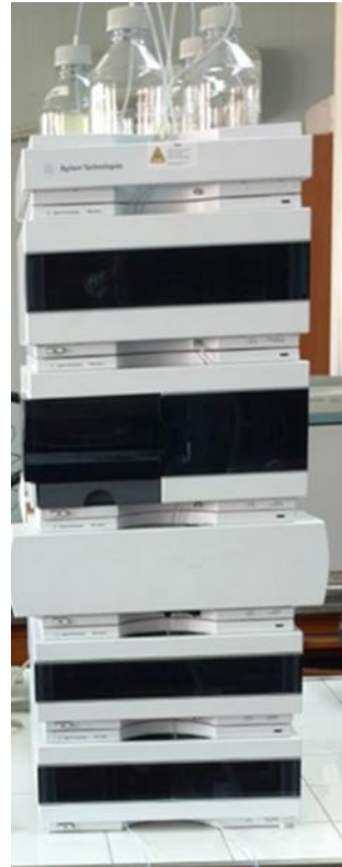
HPLC UV FLD